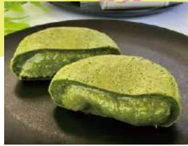
緑茶専門店 Green Tea Fields

オーガニックのお茶農家・もりもっ茶のお店です。朝つきたてのお餅でつくる作りたての大福です。もりもっ茶大福、焙じ茶大福、紅茶とみかん大福、季節の栗大福などをお持ちします。