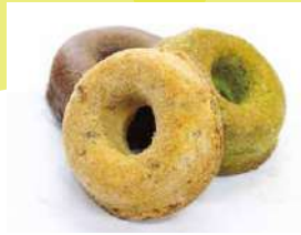
(株)宮崎経済連直販

和栗をベースに独自ブレンドした抹茶マロンクリーム。厳選した茶葉を丁寧に抽出し、栗ペーストとの絶妙バランス。そして隠し味のホワイトチョココレート。栗の甘さのあとから抹茶の渋みが駆け抜けます。