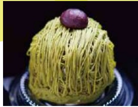
生絞りモンブラン専門店

宮崎県西都市産の有機抹茶を100%使った抹茶のお饅頭『まっちゃまん』を始め、その他にもお茶のフィナンシェや、お店で人気の宮崎茶を使ったスイーツもご準備しております。