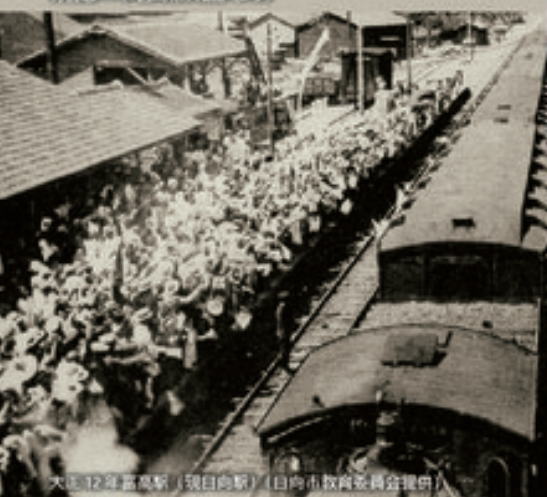
大正12年富高駅（現日向駅）