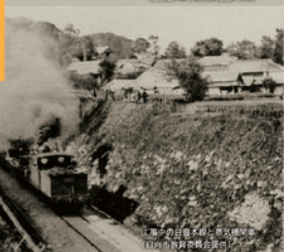
工事中の日豊本線と蒸気機関車