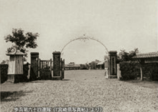
第66軍第六十番隊（『宮崎県史』より）