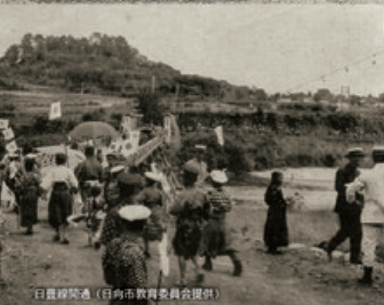
日豊線開通