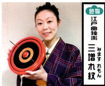
色物 江戸曲 独楽 三増 れ紋 みますれもん