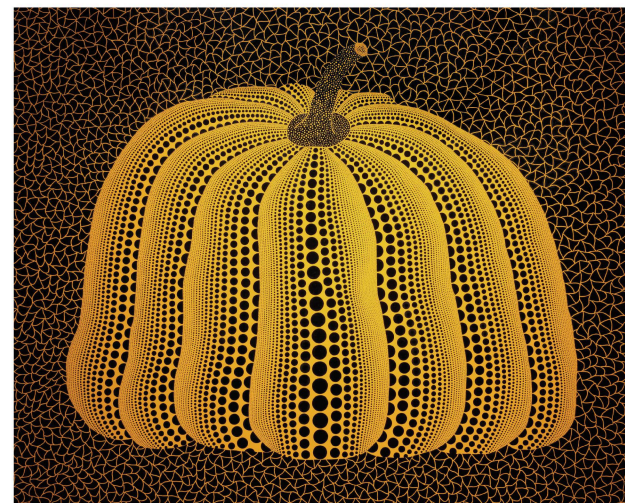
A PUMPKIN (2007年) 草間彌生 特別展 開館25周年記念 フォーエバー現代美術館コレクション 草間彌生展