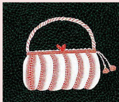
ハンドバッグ（1985年）草間彌生

募集型ワークショップ カプセルお寿司を つくろう 3月2日（日） 午前10時30分～12時 参加料無料 詳細はお問い合わせください