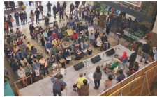
様々なイベントが開催できます