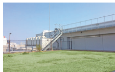
屋上でランチもおススメです