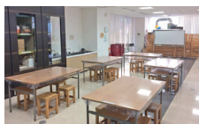
絵本や木の遊具を備えたキッズルーム、ご飲食も可能な交流サロン