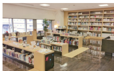
ライブラリーにはアートに関する書籍・漫画などがそろっています