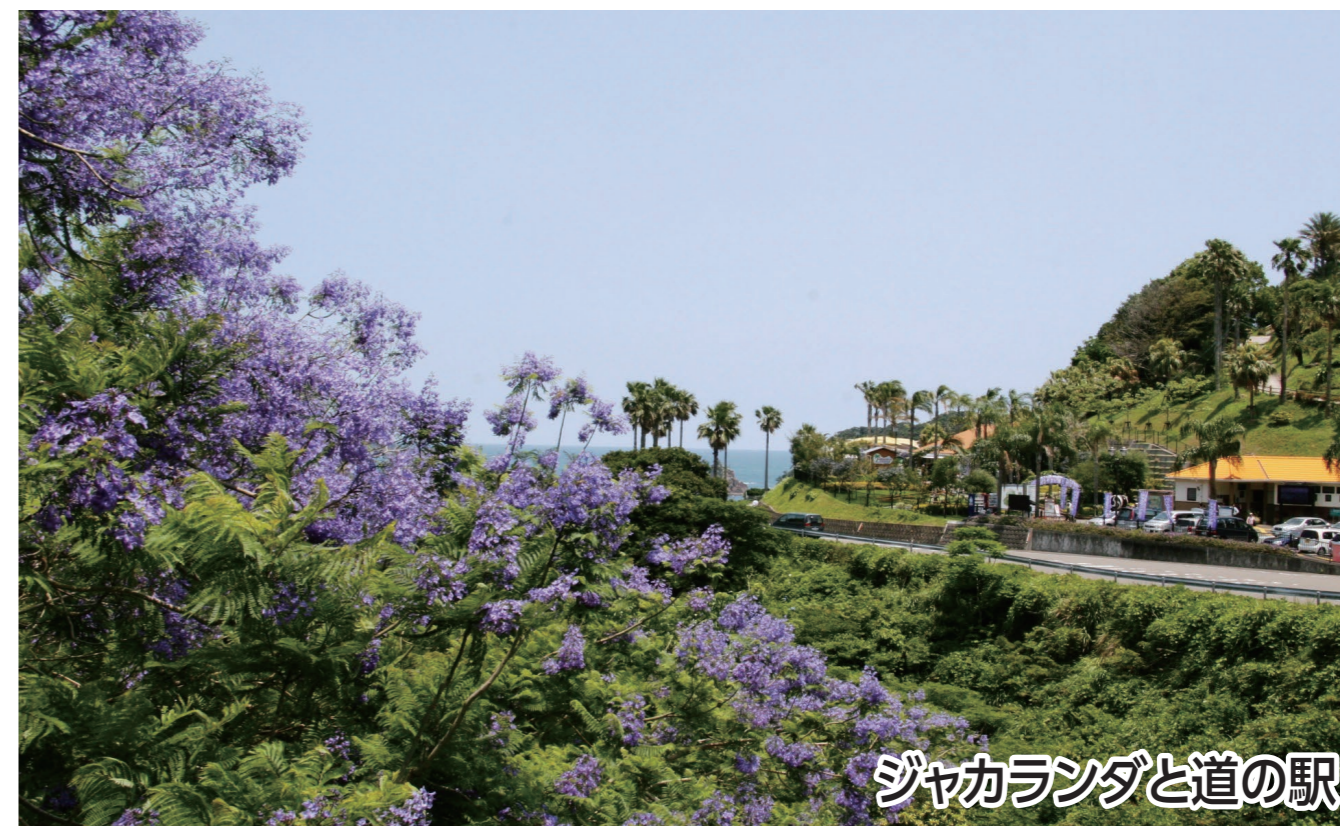
ジャカランダと道の駅

世界三大花木の1つである「ジャカランダ」に囲まれ、潮風を感じながら、太平洋が広がる日南海岸をお楽しみいただけます。