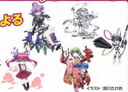
イラスト: 姫川たけお

ユニークなキャラクターたちが、毒ワールドを分かりやすく解説して、ドキドキ・ワクワクさせちゃいます!