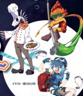
イラスト: 廻川たけお 『毒物ずかん』と毒モンスター展がコラボレーション!