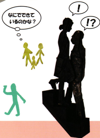
マリーオ・チェローリ「昇る人と降りる人」