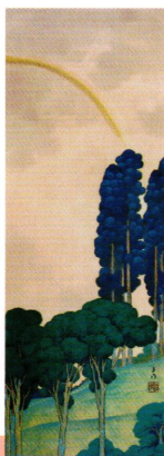
山内多門「虹」(寄託作品)