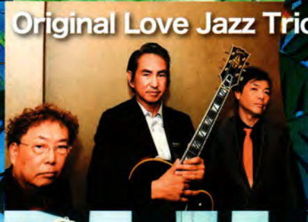
Original Love Jazz Trio