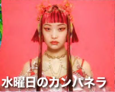
水曜日のカンパネラ