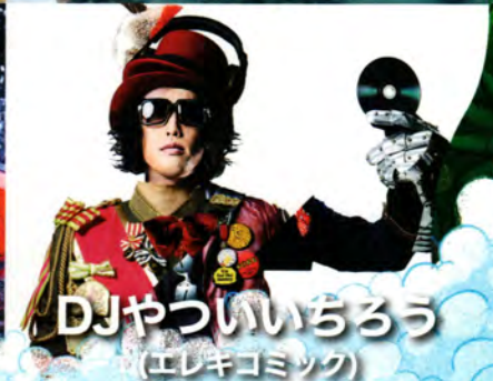
DJやっぴいちろう (エレキコミック)