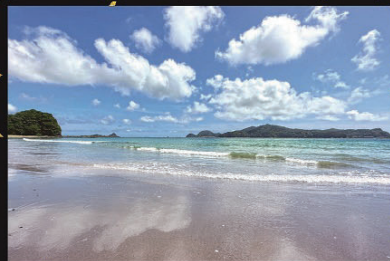
『下阿蘇海岸 真夏の島の夢』