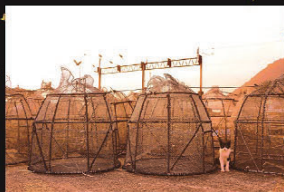
『伊勢えび漁の番人』

入賞品 ●伊勢えび賞(1名):伊勢えび1kg相当 ●特産品賞(2名):地域の特産品