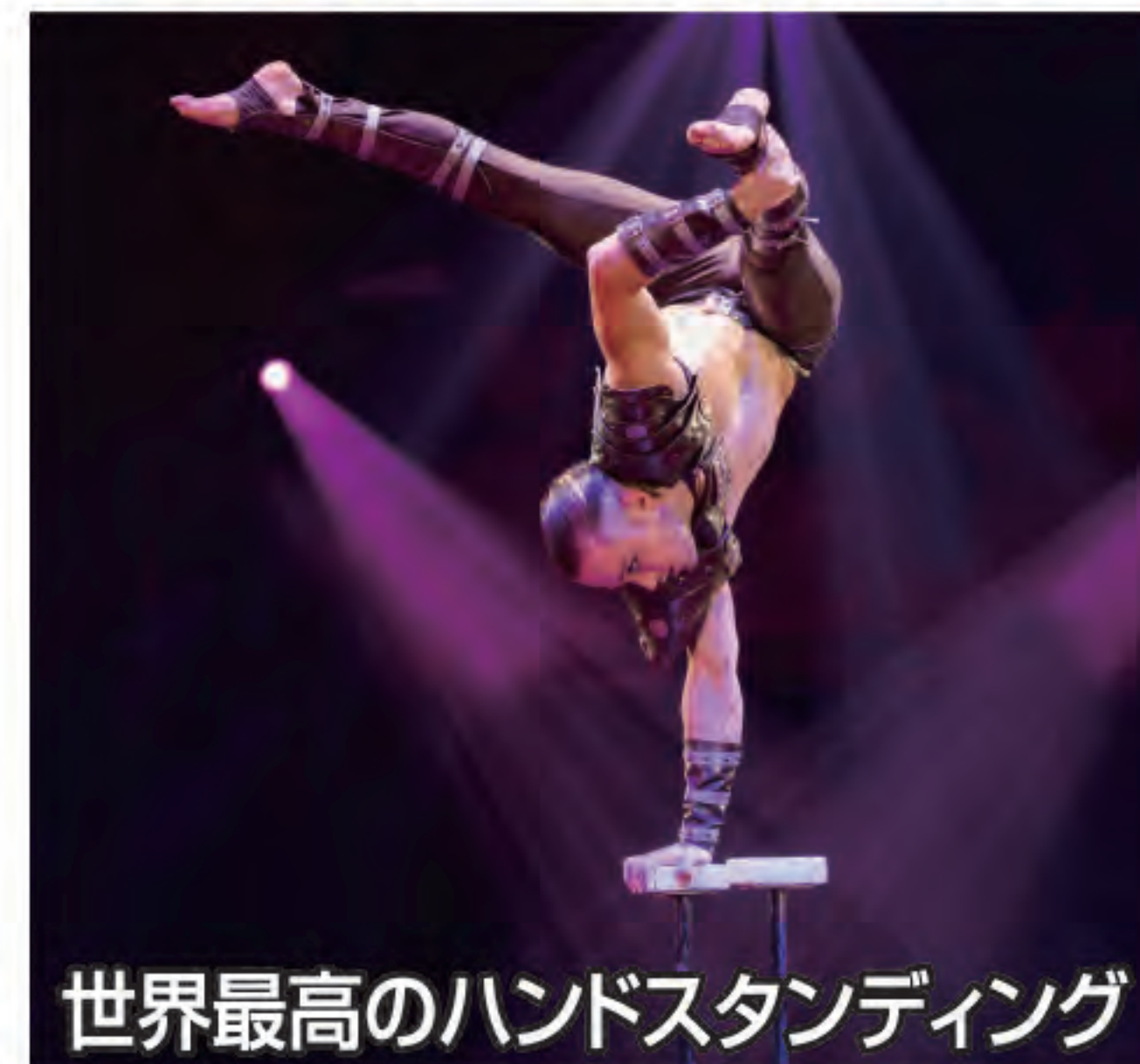
世界最高のハンドスタンディング