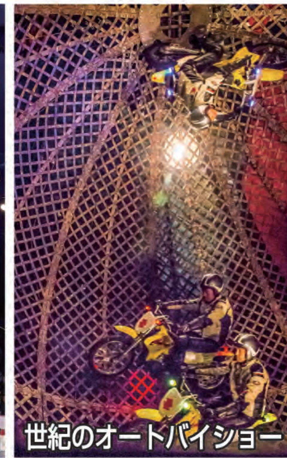
世紀のオートバイショー