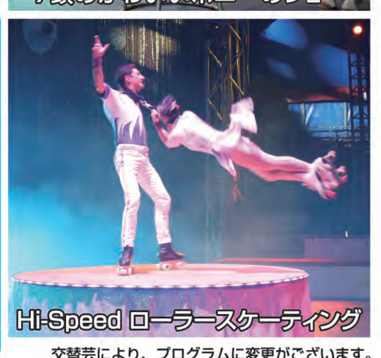
Hi-Speed ローラースケート