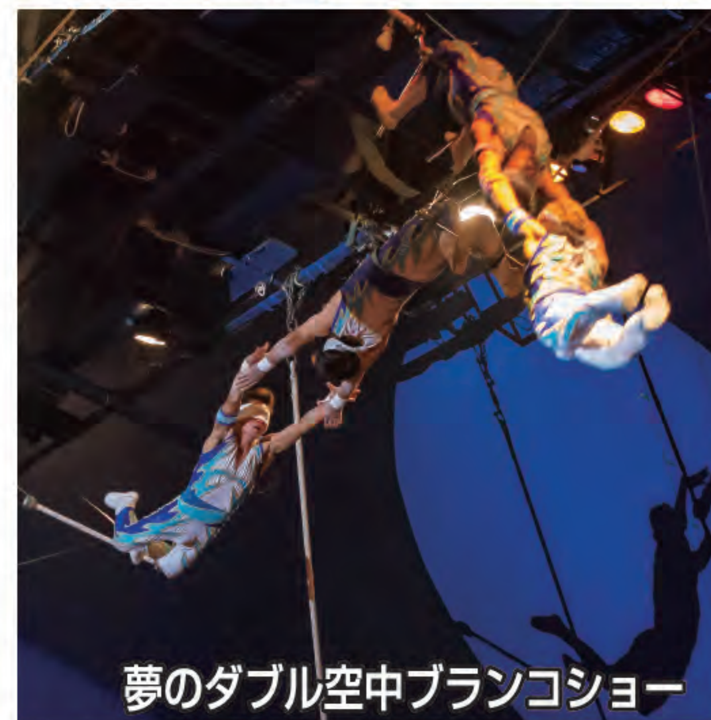
夢のダブル空中ブランコショー