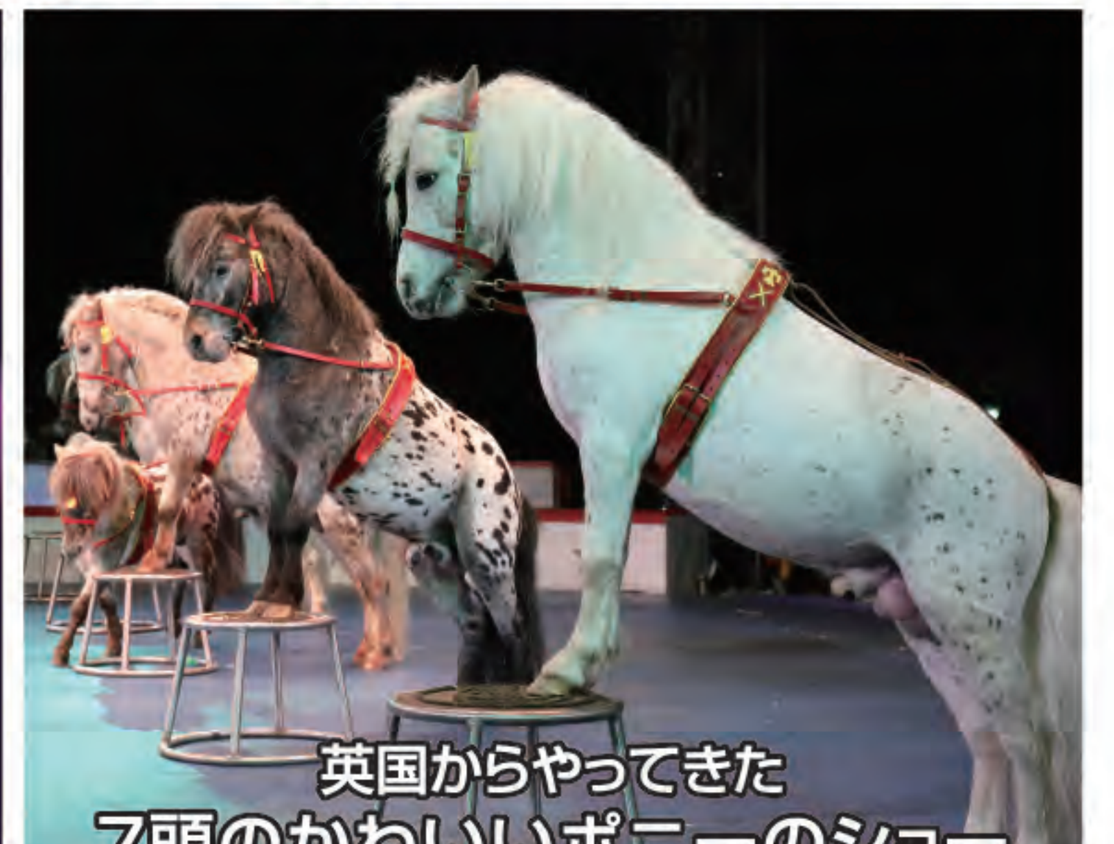
英国からやってきた 7頭のかわいいポニーのショー