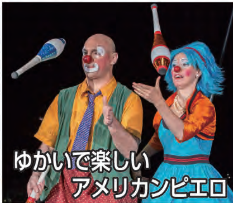
ゆかいで楽しい アメリカンピエロ