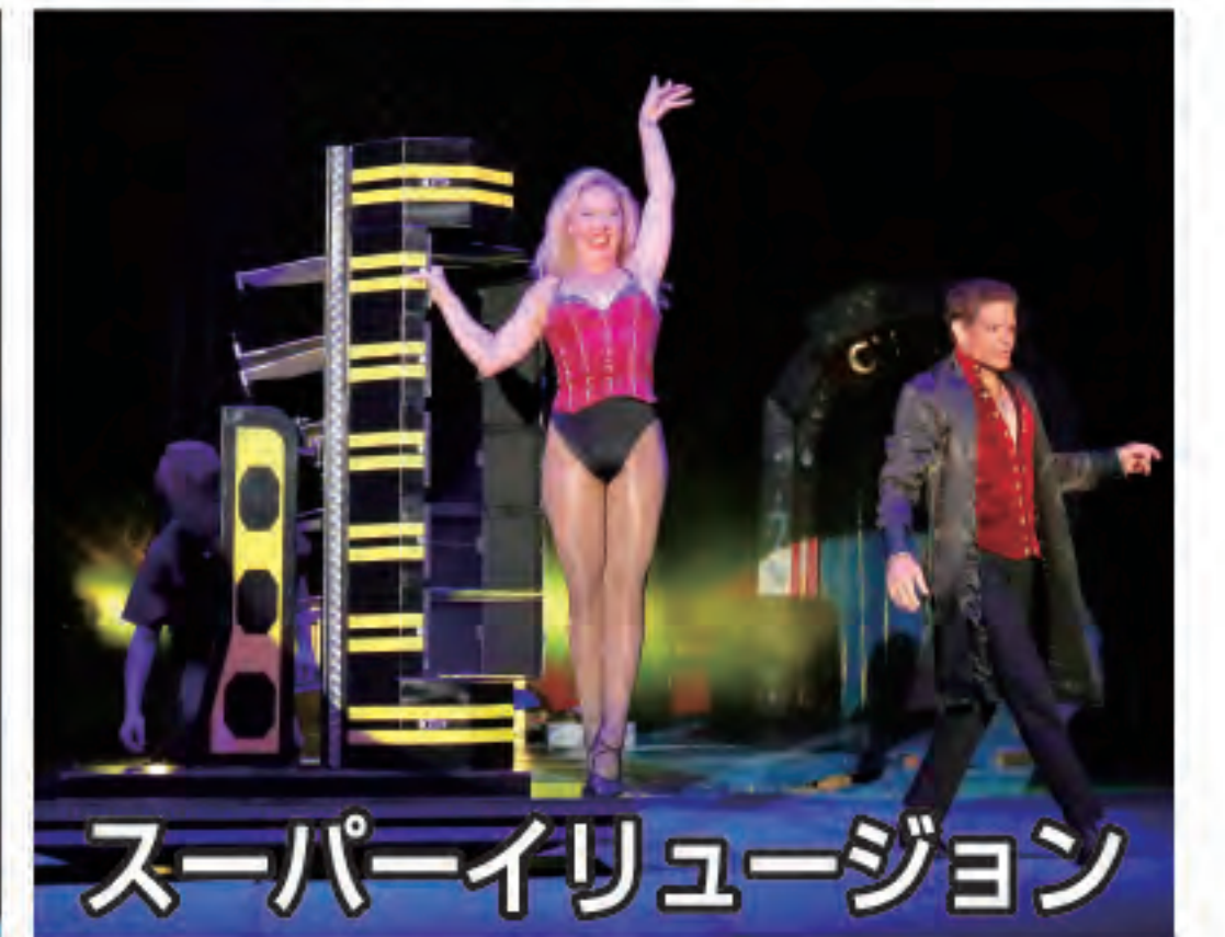
スーパーイリュージョン