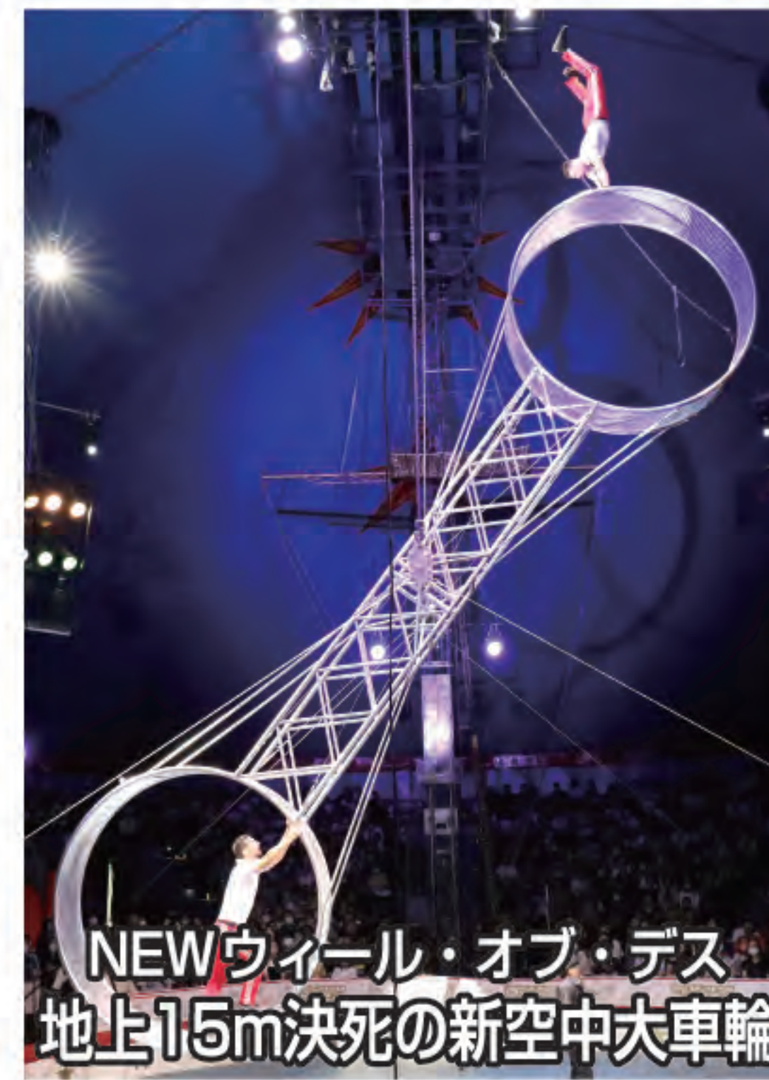
NEWウィール・オブ・デス 地上15m決死の新空中大車輪